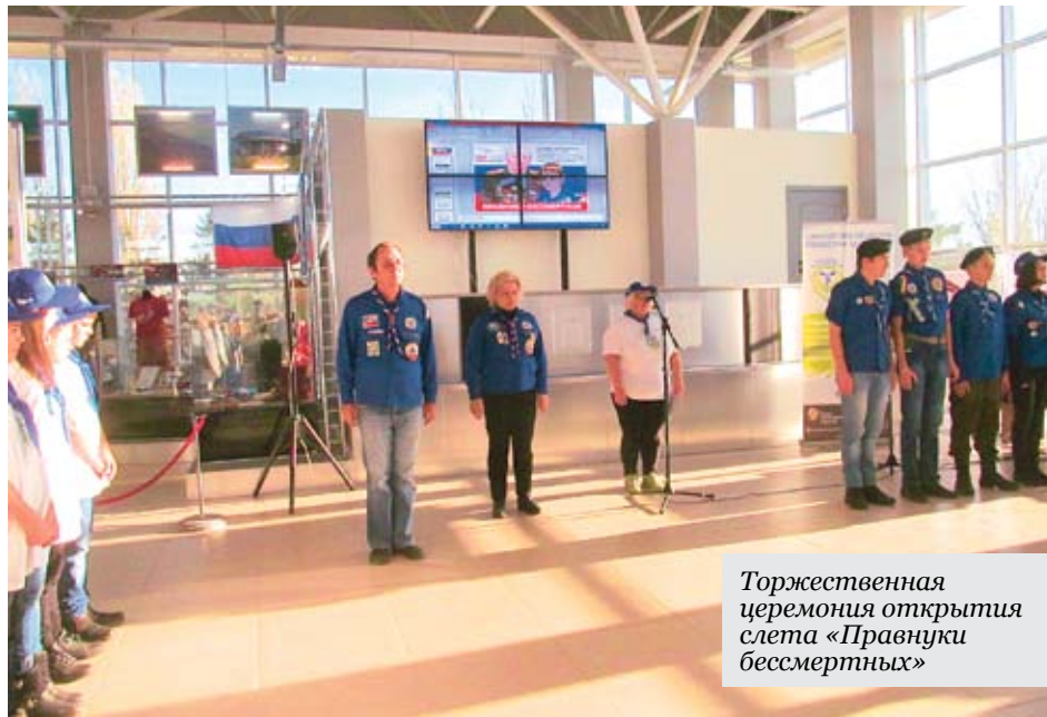
Торжественная церемония открытия слёта «Правнуки бессмертных»