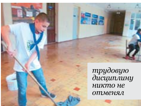
Трудовую дисциплину никто не отменял