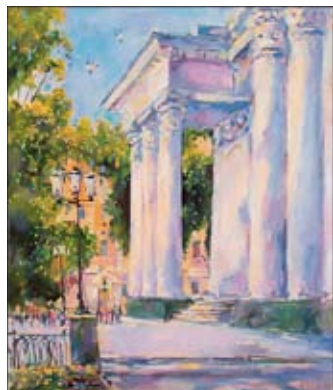
«Театр оперы», 2002 г.

Надеемся вновь увидеть его новые живописные, графические поиски.