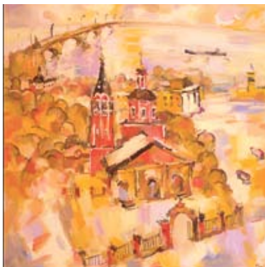
«В городе праздник», 2008 г.