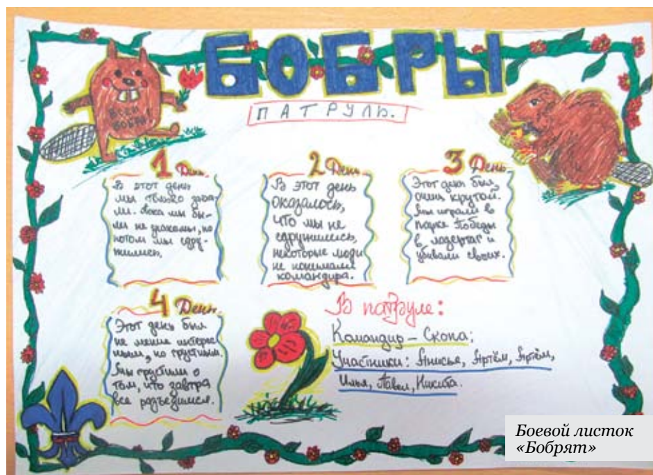
Боевой листок «Бобрят»