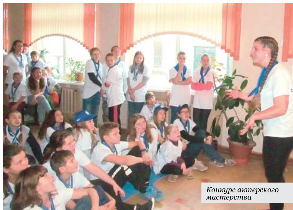
Конкурс актерского мастерства