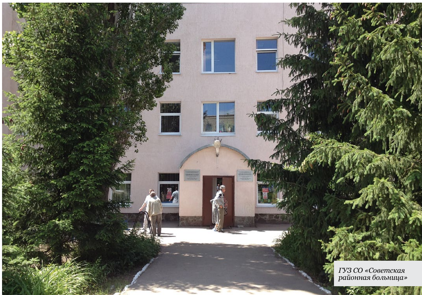
ГУЗ СО «Советская районная больница»