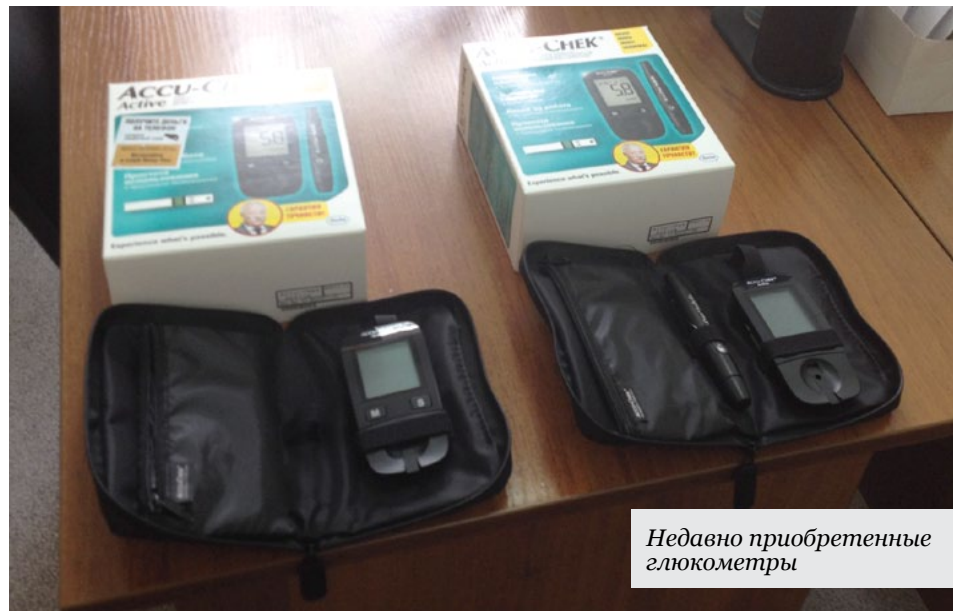
Недавно приобретенные глюкометры

По данным бухгалтерии учреждения среднемесячная заработная плата рядовых врачей-специалистов (без учета руководства) за период январь-май 2016 составила 31,1 тыс. рублей, а среднего медицинского персонала (медсестер) – 15,4 тыс. рублей.