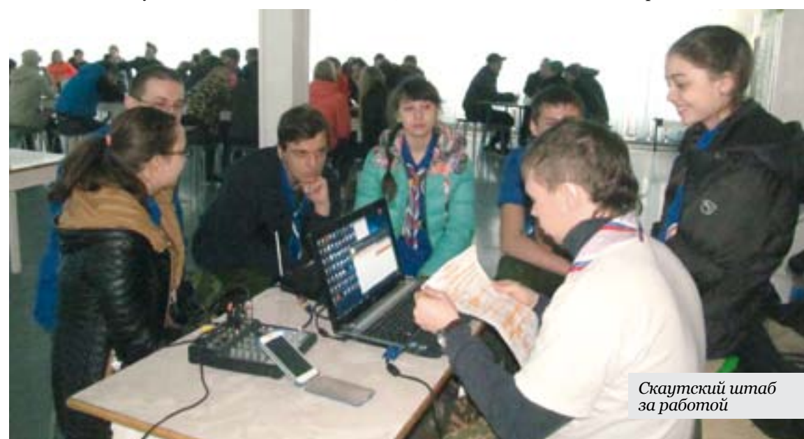
Скаутский штаб за работой