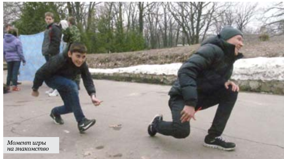
Момент игры на знакомство

Таковыми же насыщенными получились и другие игры, занятия, тренинги, прошедшие во вторник и среду. Запомнятся и шумные, подвижные соревнования по лазертагу, и скаутский ночной бег, и состязания команд, проведенные сотрудниками МЧС, и интеллектуальный конкурс — брейн-ринг «Дни воинской славы», и заключительная операция «Нас здесь не было!» — уборка территории перед отъездом. И многие, если не каждый, расставаясь с ребятами республикой, мысленно благодарили дни слета: «Спасибо, «Дубрава!»