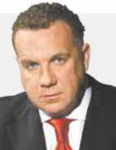
Олег ГРИЩЕНКО, глава муниципального образования «Город Саратов»:

— Моя дочь поедет в лагерь «Лесная республика» в июле. Я с оптимизмом надеюсь, что организационная часть отдыха будет на высоте, а именно: спальные места, уборные, свежее питание.