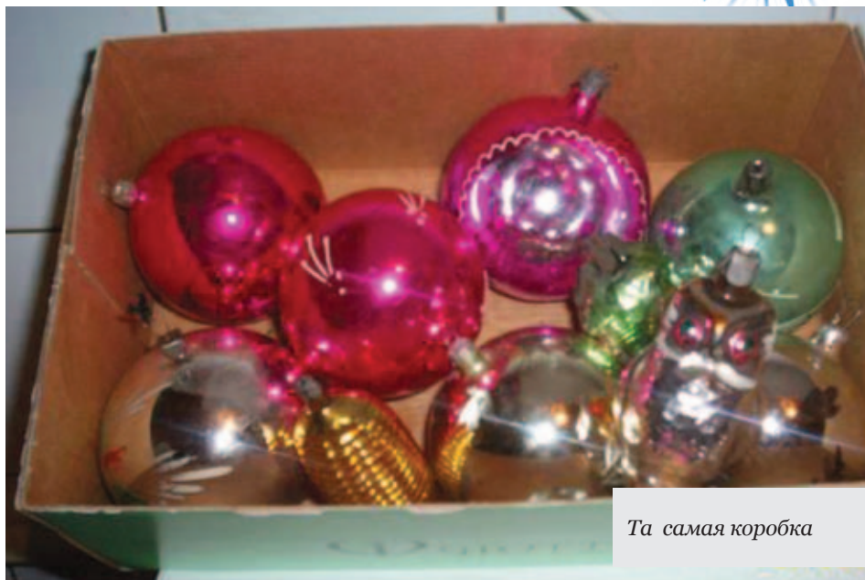
Та самая коробка

О том, что в Саратове тоже выпускались ёлочные игрушки и электрогирлянды, знают многие. Областная пресса, например, широко в своё время