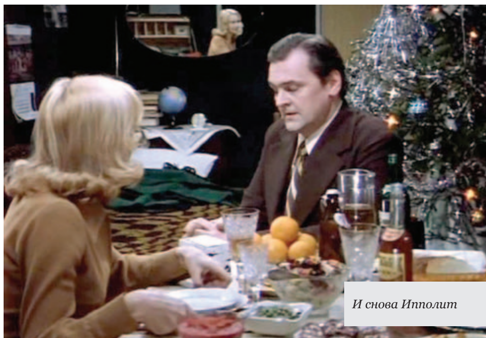
И снова Ипполит

Мне давно хотелось рассказать что-то о ёлочных игрушках, об истории их создания, о мастерах, обладающих даром работать с самой хрупкой в мире материей