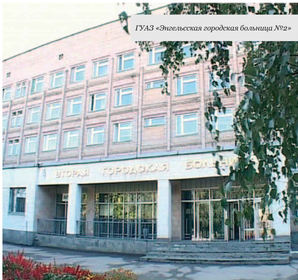
ГАУЗ «Энгельсская городская больница №2»

Дополнительные денежные вливания позволили Энгельсской городской больнице № 2 не только привести в порядок имеющееся, но и приобрести новое оборудование, среди которого аппарат для УВЧ, анализатор показателей гемостаза, аппарат для пневмомассажа, лазерный аппарат «Милта», аппарат «Оптодан», ультрафиолетовые облучатели, суховоздушные термостаты, механические тонометры, компрессорные ингаляторы, концентраторы кислорода, микроскопы, пульсоксиметры и др.