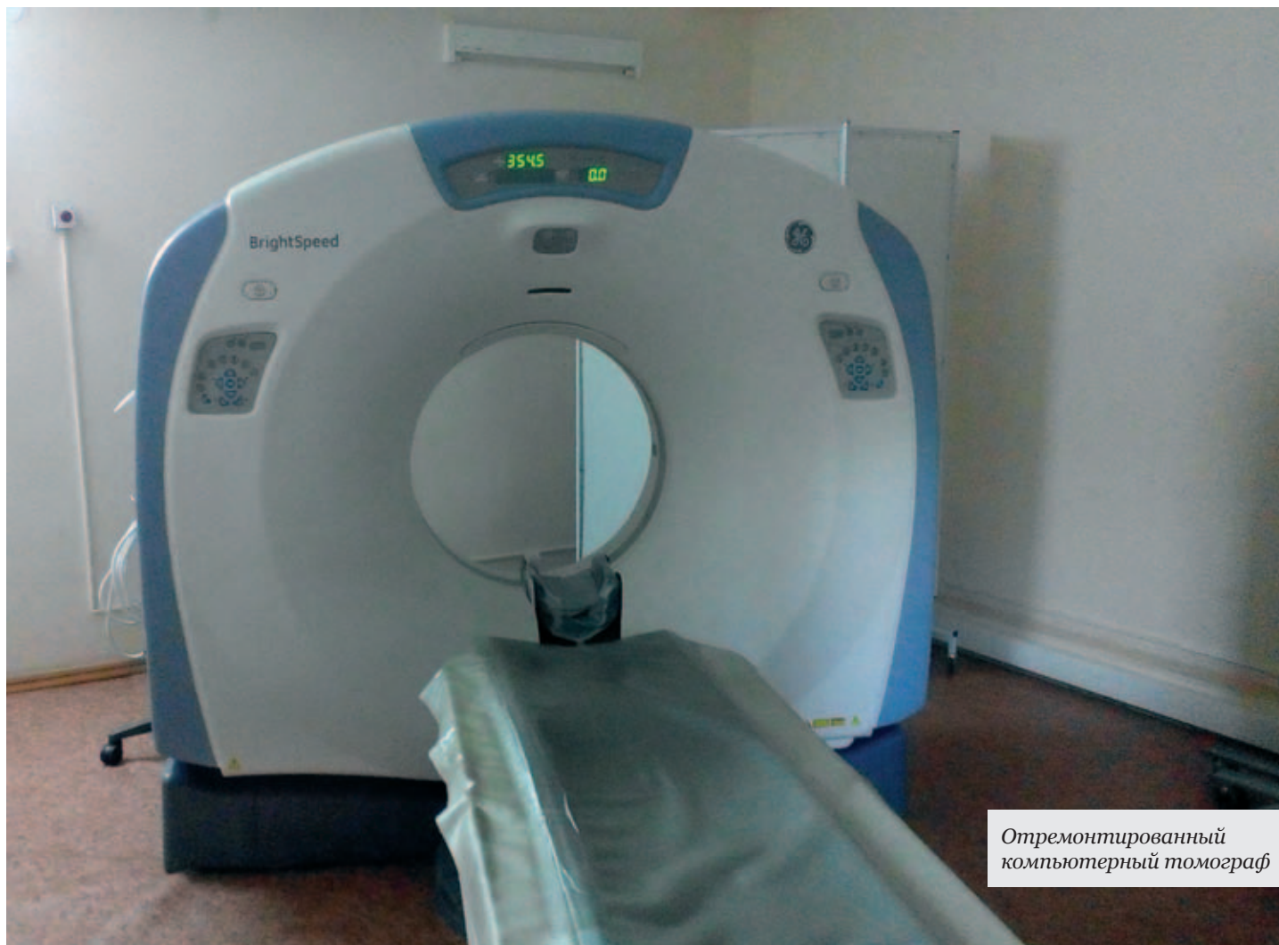
Отремонтированный компьютерный томограф