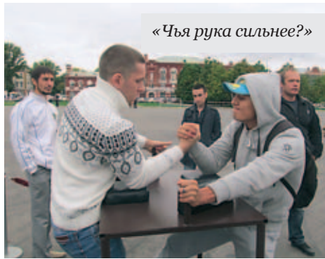
«Чья рука сильнее?»

щадке, где студенты азартно перебрасывали волейбольный мяч, глава администрации не выдержал и, отдав пиджак своему помощнику, влился в круг, вспомнив молодость и показав пару отменных ударов!