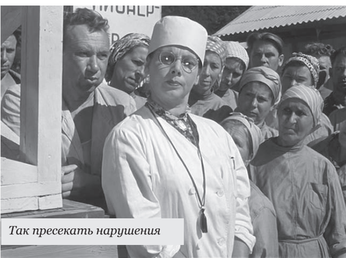
Так пресекать нарушения