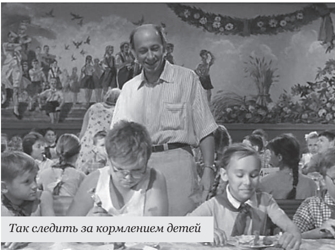
Так следить за кормлением детей