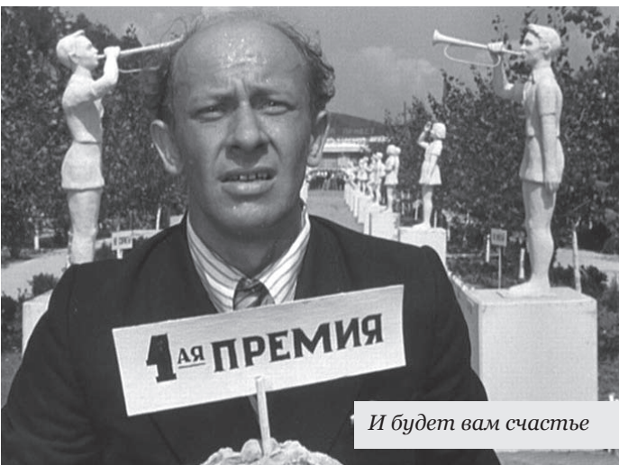
И будет вам счастье