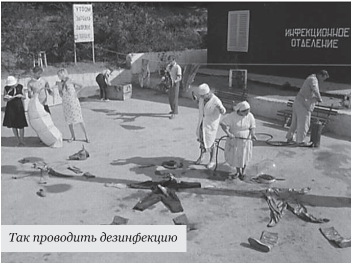
Так проводить дезинфекцию