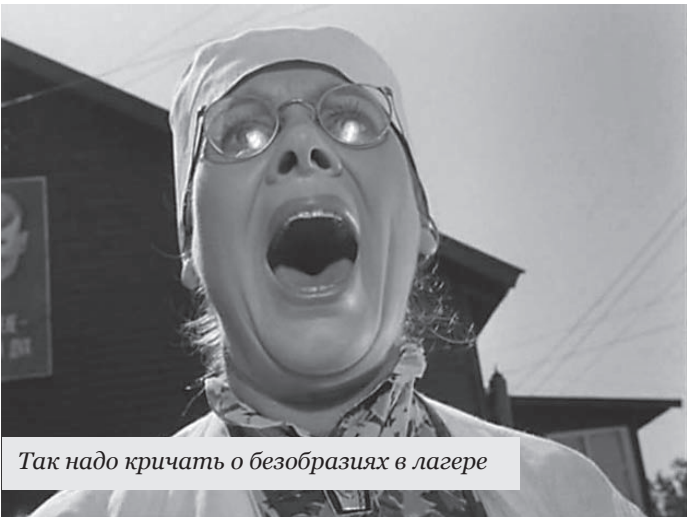
Так надо кричать о безобразиях в лагере