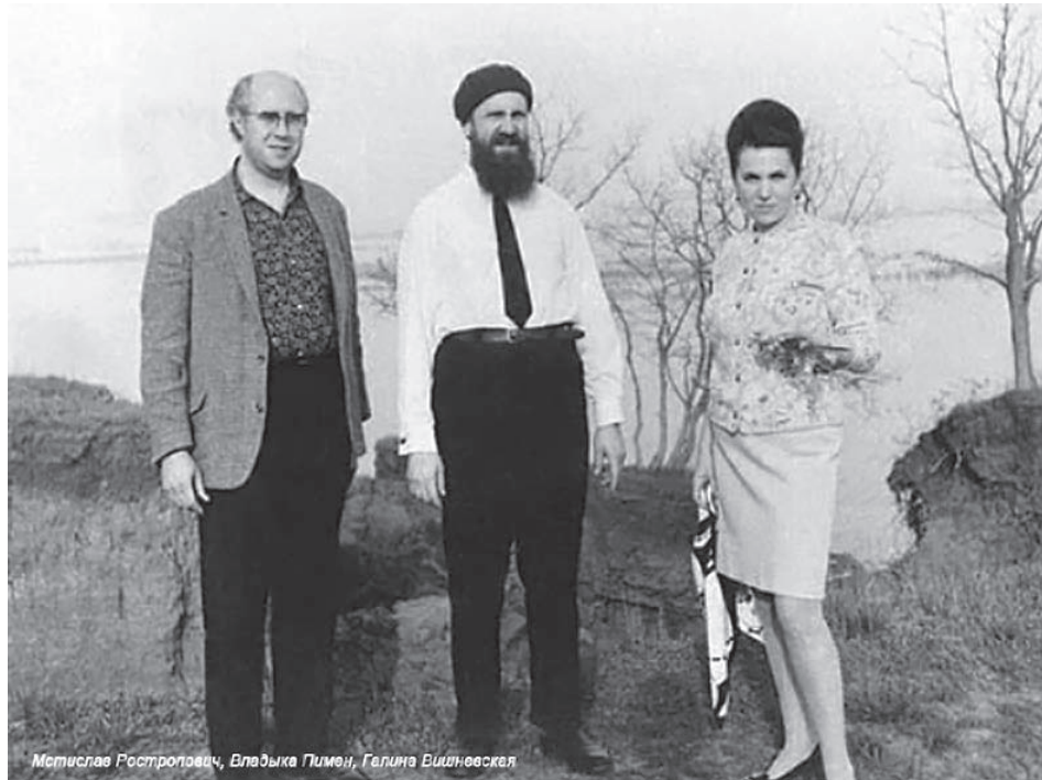
Мстислав Ростропович, Владыка Пимен, Галина Вишневская

Жизнь самой, пожалуй, блистательной пары XX и XXI веков – Мстислава Ростроповича и Галины Вишневской, связана с Саратовом необычным образом: в нашем городе они обвенчались