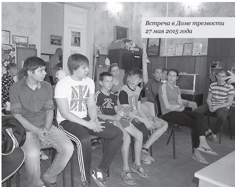
Встреча в Доме трезвости 27 мая 2015 года