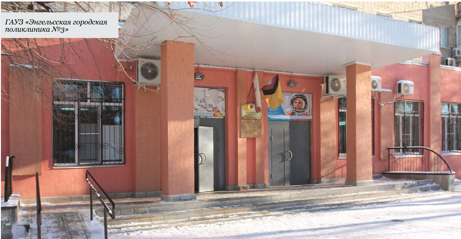
ГАУЗ «Энгельсская городская поликлиника №3»