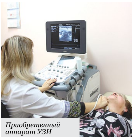
Приобретенный аппарат УЗИ

Для того, чтобы жители г. Энгельса могли получить медицинскую помощь на высоком уровне в своей поликлинике, было приобретено и другое дорогостоящее оборудование, в числе которого гематологический и флуориметрический анализаторы, офтальмологический бесконтактный тонометр, компьютерный электрокардиограф, автоматический анализатор глюкозы, реографический комплекс для автоматизированной оценки системного и регионарного кровотока и многое другое.