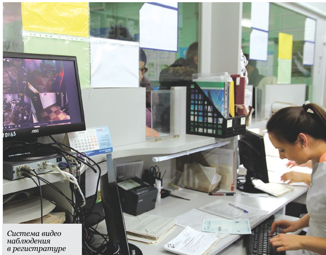
Система видео наблюдения в регистратуре