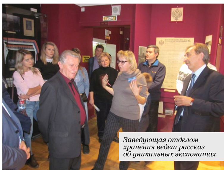
Заведующая отделом хранения ведет рассказ об уникальных экспонатах