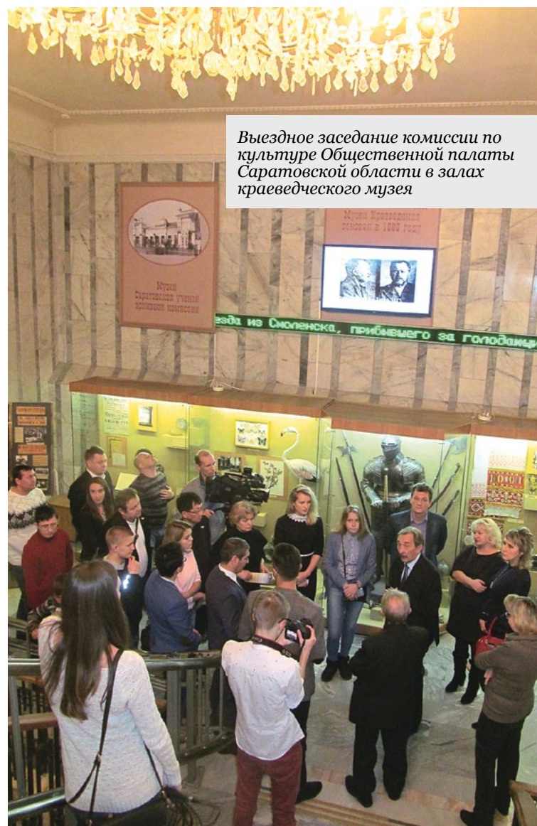
Выездное заседание комиссии по культуре Общественной палаты Саратовской области в залах краеведческого музея