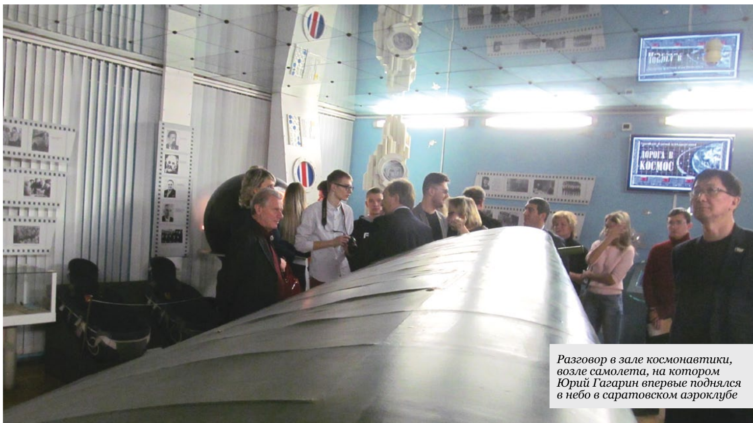
Разговор в зале космонавтики, возле самолета, на котором Юрий Гагарин впервые поднялся в небо в саратовском аэроклубе

Но для этого нужен закон местной власти. Изменить законодательство нужно и для ремонта здания музея. Дело в том, что коллекция музея – собственность федеральная, а здание – на балансе областном, потому Москва и не может выделить средства для реставрации исторического здания музея, а в местном «кошельке» на эти цели денег нет. Об этом председателю Общественной палаты рассказал директор музея. Еще Евгений Казанцев попросил Александра Ландо выйти с законодатель-