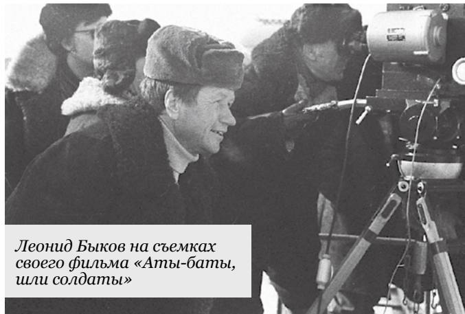
Леонид Быков на съемках своего фильма «Аты-баты, шли солдаты»

х/ф «Аты-баты, шли солдаты...» реж. Л. Быков