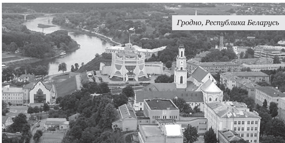
Гродно, Республика Беларусь

Совет Общественной палаты Саратовской области обсудил проекты создания нового городского парка на землях НИИ «Юго-Востока»