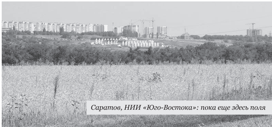
Саратов, НИИ «Юго-Востока»: пока еще здесь поля

Вот и в представленных проектах, всех без исключения, тема будущего («футуристическая», как пошутил один из журналистов) звучала отчетливо. По существу, все идеи сводятся пока к трем основным концепциям, к трем главным подходам. «Космическая» и «Земная» (или «Приземленная») темы разработаны в недрах СГТУ: кафедра архитектуры и кафедра архитектурного дизайна среды всегда отличались ярким творческим подходом, нестандартностью решений.