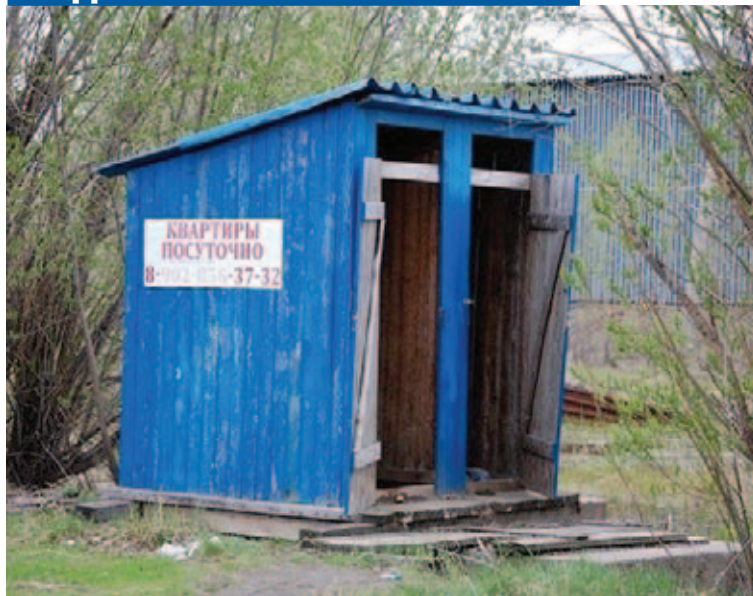
Простенько и экологично