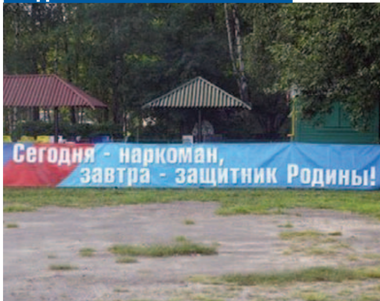
Отечество в опасности!