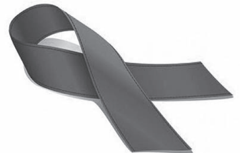
Заболевание, синдром приобретённого иммунодефицита, вызываемый ВИЧ