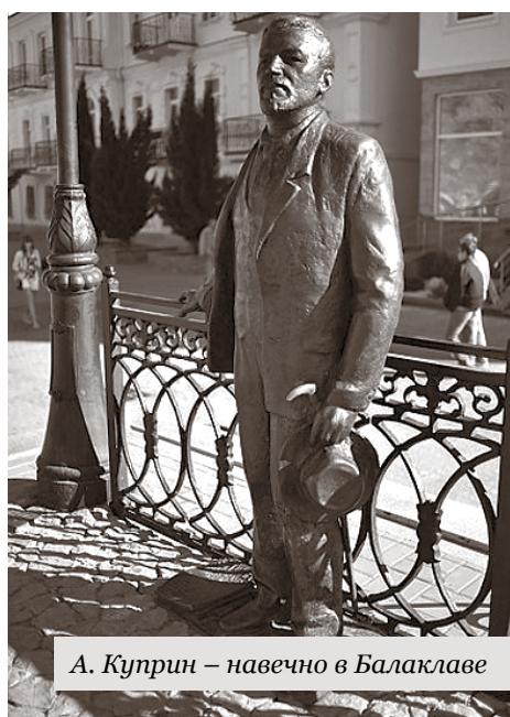
А. Куприн – навечно в Балаклаве

приготовить парочку рыбин. Для этого возьмём две скумбрии – желательнее по крупнее. Лучше брать с головами, чтобы легче было определить свежесть. Головы отрезаем, тушки потрошим, и, сделав глубокий надрез на спине острым ножом, вытаскиваем хребет. Итак, у нас в руках филе скумбрии – настоящая кулинарная драгоценность. Теперь самое время этому богатству найти достойное обрамление. Нам нужно будет запастись горсткой муки, яйцом, половиной ли-