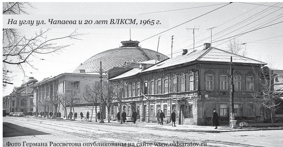
На углу ул. Чапаева и 20 лет ВЛКСМ, 1965 г.

Выражаю благодарность сотрудникам Саратовской областной универсальной научной библиотеки за информационную поддержку и неравнодушное отношение