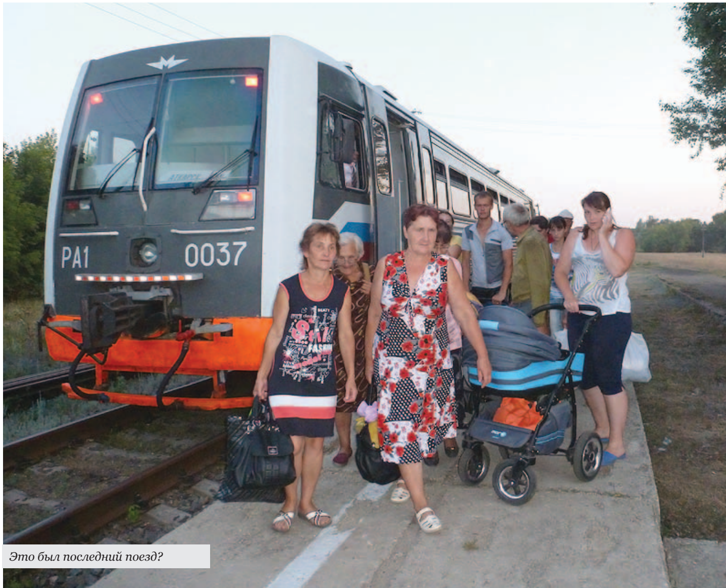
Это был последний поезд?

Состоялось расширенное заседание Совета Общественной палаты Саратовской области рассмотрел ситуацию, сложившуюся в регионе с пригородными железнодорожными перевозками