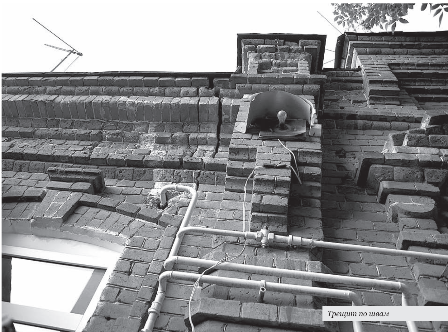
Трещит по швам