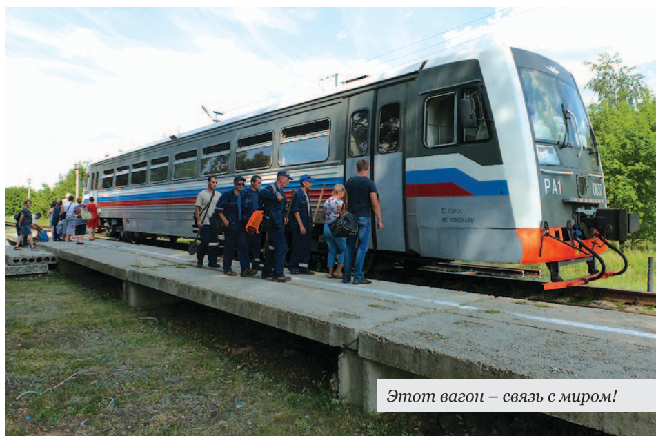
Этот вагон – связь с миром!

Обнадеживает тот факт, что в ходе обсуждения внесенного в повестку вопроса были четко обозначены болевые точки, приведшие к кризисной ситуации, услышаны аргументы всех сторон. Хочется верить, что выход из ситуации будет найден, прежде всего, в пользу населения сельской глубинки.