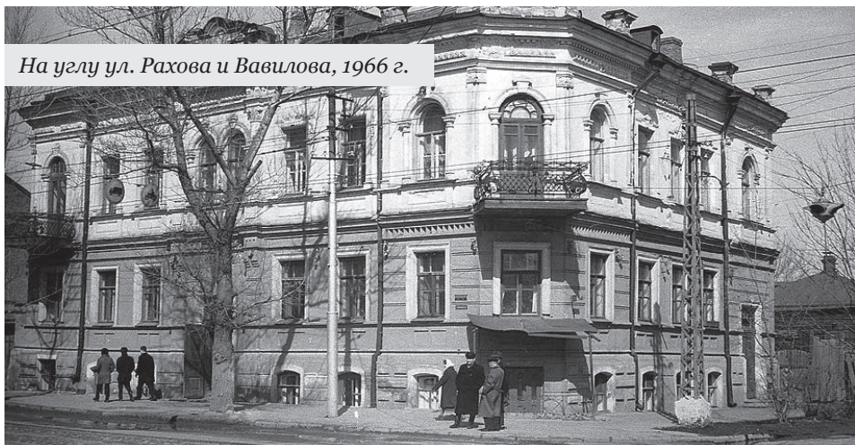
На углу ул. Рахова и Вавилова, 1966 г.