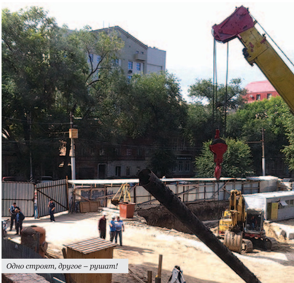
Одно строят, другое – рушат!