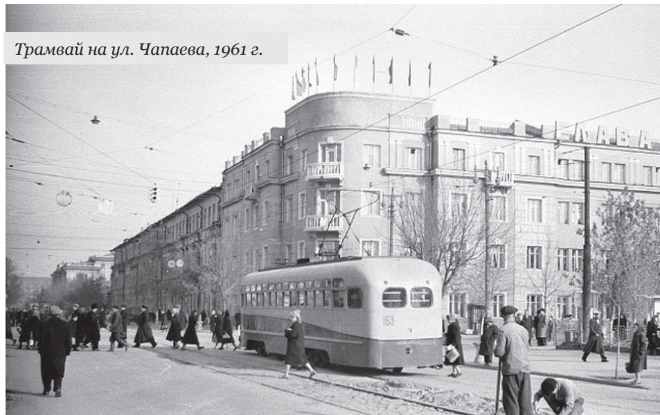
Трамвай на ул. Чапаева, 1961 г.