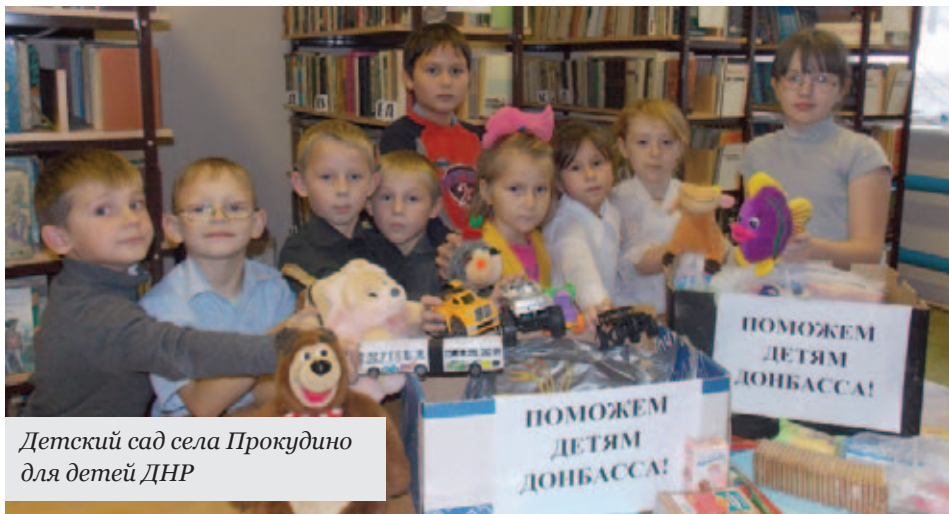
Детский сад села Прокудино для детей ДНР

Друзья, коллеги поздравляют с юбилеем и желают новых свершений!