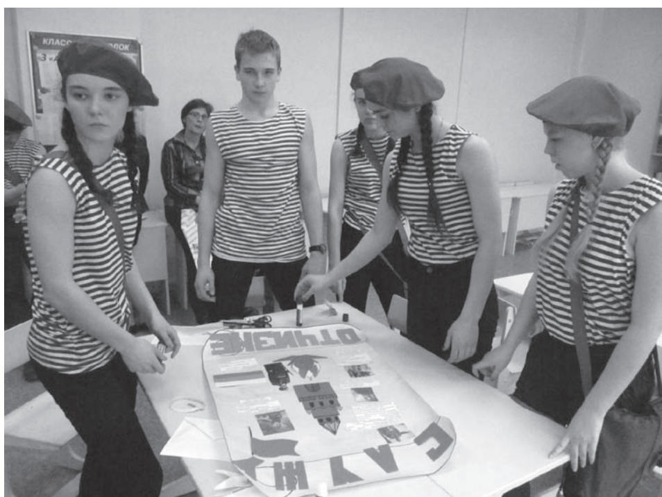
Боевой листок школы № 10 готов