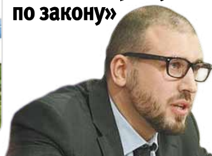
член ОП РФ Вениамин РОДНЯНСКИЙ