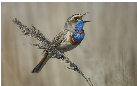
Варакушка (лат. Luscinia svecica )

Страны-участницы Дней наблюдений соревнуются между собой: где будет отмечено наибольшее количество