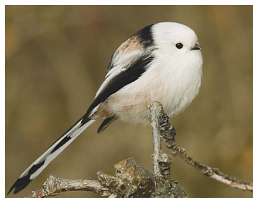
Ополовник (Длиннохвостая синица) (лат. Aegithalos caudatus )