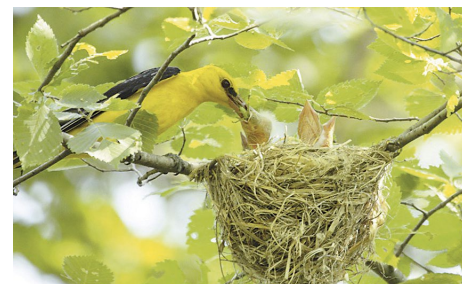
Обыкновенная иволга (лат. Oriolus oriolus )

во видов птиц, учтено наибольшее число особей, в какой стране будет максимальное число участников акции. В последние годы чемпионский титул Дней наблюдений завоевывается россиянами.