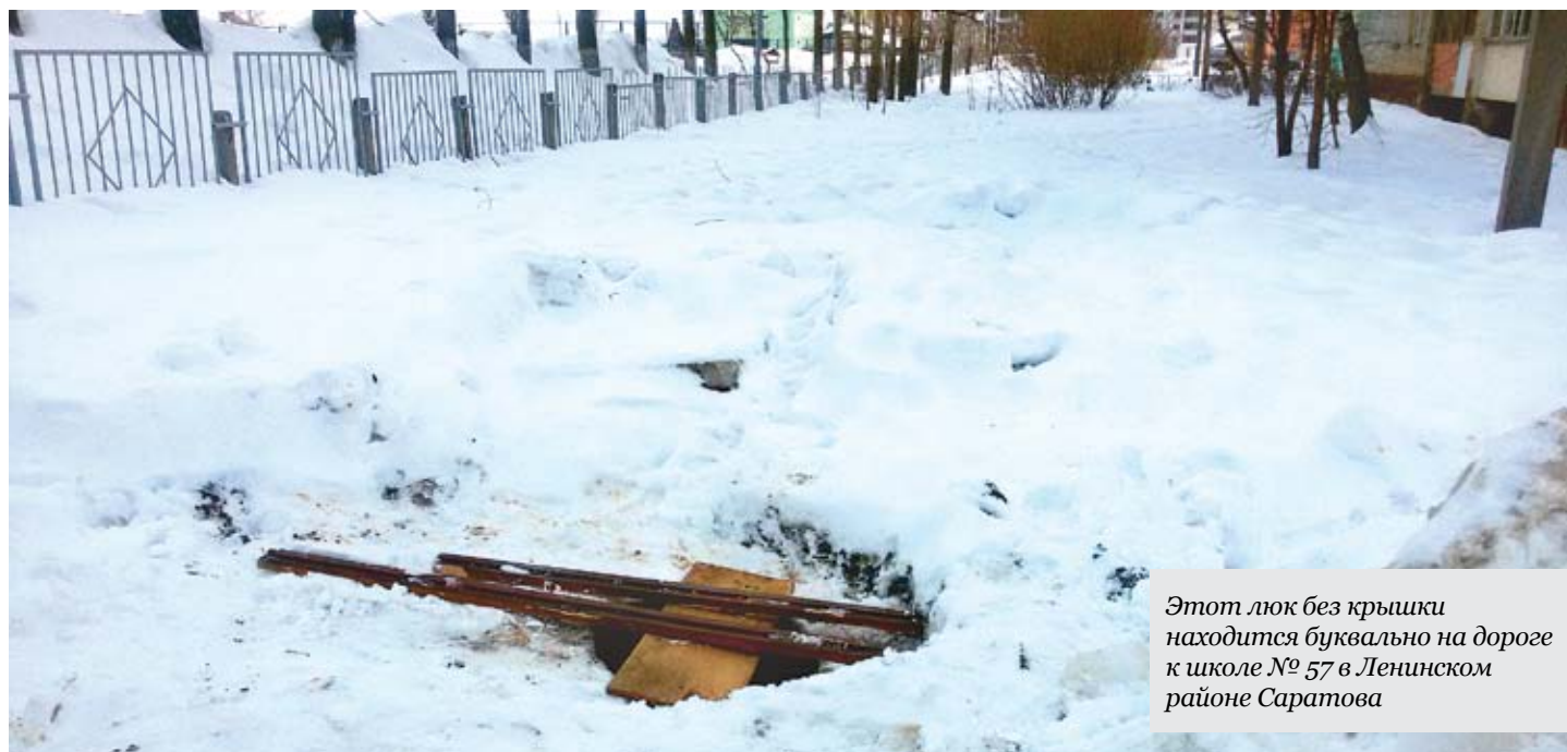
Этот люк без крышки находится буквально на дороге к школе № 57 в Ленинском районе Саратова

В Общественной палате области искали способы закрыть канализационные люки крышками