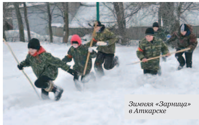
Зимняя «Зарница» в Аткарске