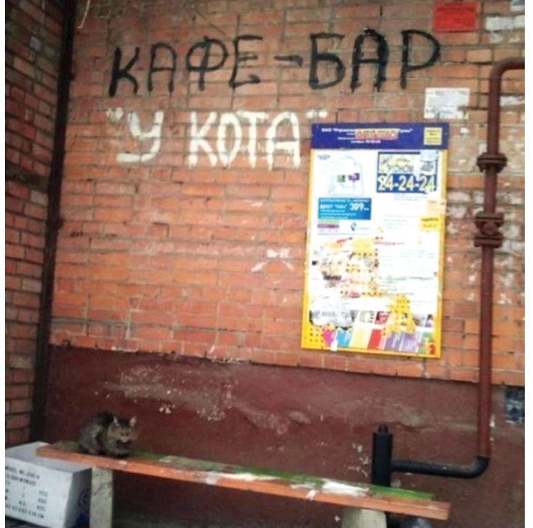
Свежие рыбки хвосты, деликатесы из помойки, валерьянка от бабушки, приятная компания