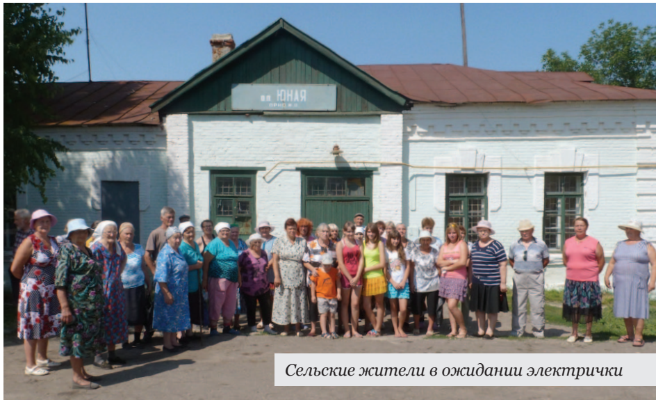
Сельские жители в ожидании электрички