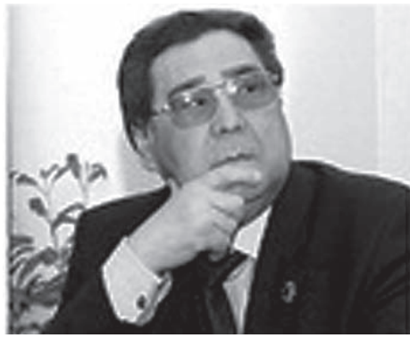
Аман Тулеев Кемеровская область