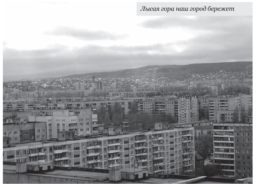
Лысая гора наш город бережет

– А про клады Золотой Орды что-нибудь писали?