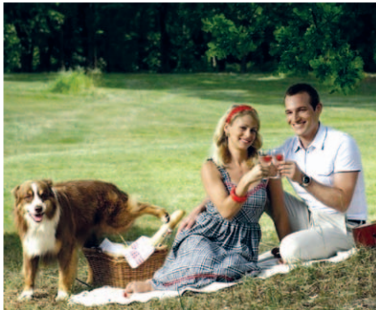
Всегда есть кому испортить фотографию