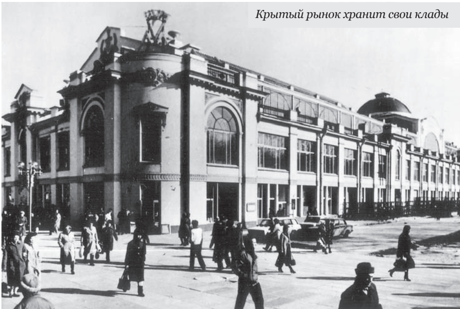
Крытый рынок хранит свои клады

– Не так-то просто найти этот клад! О нем «Саратовские Губернские Ведомости» писали еще в 1859 году. Некий бурлак рассказывал, что вместе с товарищем обнаружил на утесе тайный ход. Спустившись под землю, бурлаки оказались в роскошных хоробах. По стенам висели иконы в осыпанных драгоценными камнями окладах,