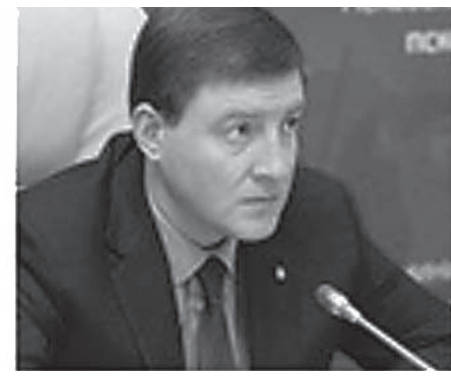
Андрей Турчак Псковская область