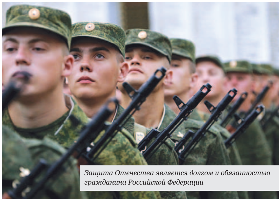
Защита Отечества является долгом и обязанностью гражданина Российской Федерации