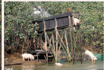
Лето — для всех!