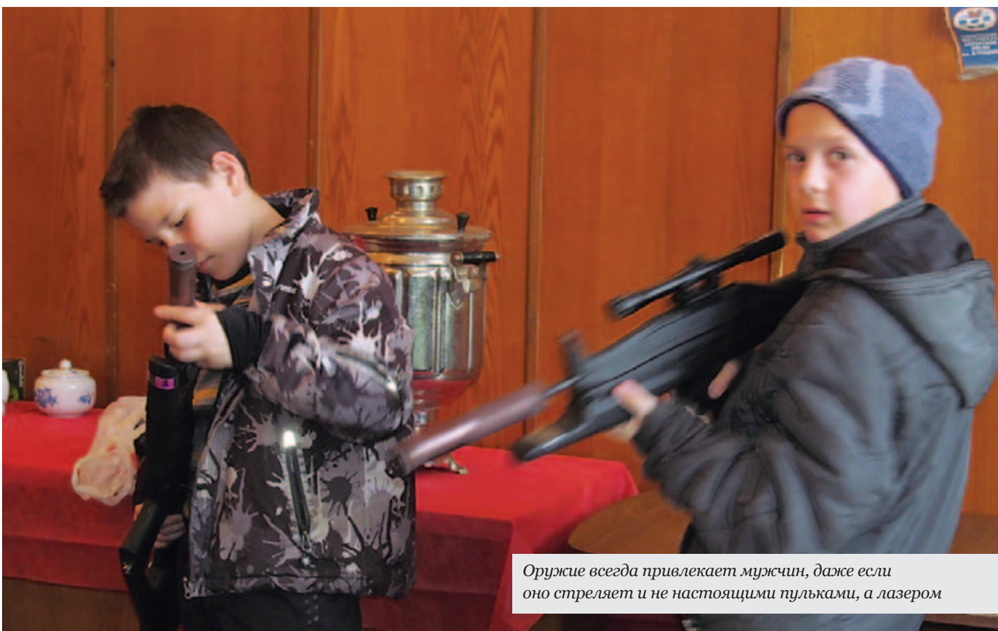
Оружие всегда привлекает мужчин, даже если оно стреляет и не настоящими пулями, а лазером

Час знакомства со «здравым толком» общества трезвости промелькнул незаметно, но впереди – новые встречи, и мы надеемся, что на следующих беседах пойдет уже конкретный разговор: что и как нужно делать, чтобы поехать в лагерь. Надеемся, что желающих присоединиться к нашему проекту будет достаточно, а отказывать никому не будем, на то он и здравый толк, чтобы обстоятельно обо всем договориться.