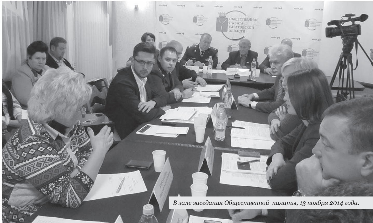
В зале заседания Общественной палаты, 13 ноября 2014 года.

А она, ситуация, весьма тревожна. Без всяких социологических исследований видно, как за последнее десятилетие курение без труда завоевало новую аудиторию. Почти поголовно ста-