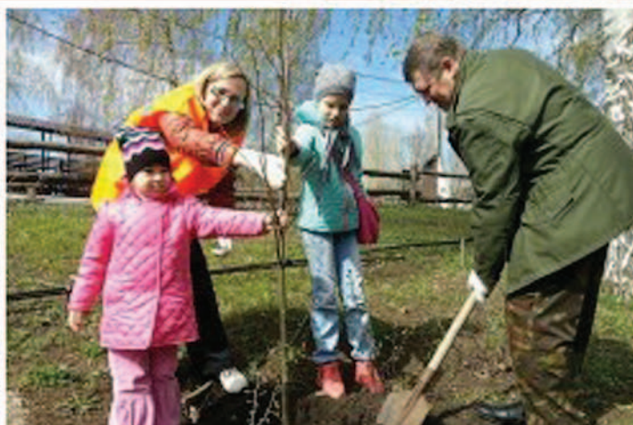
Фоторабота «Высадка аллеи», Букреева Оксана